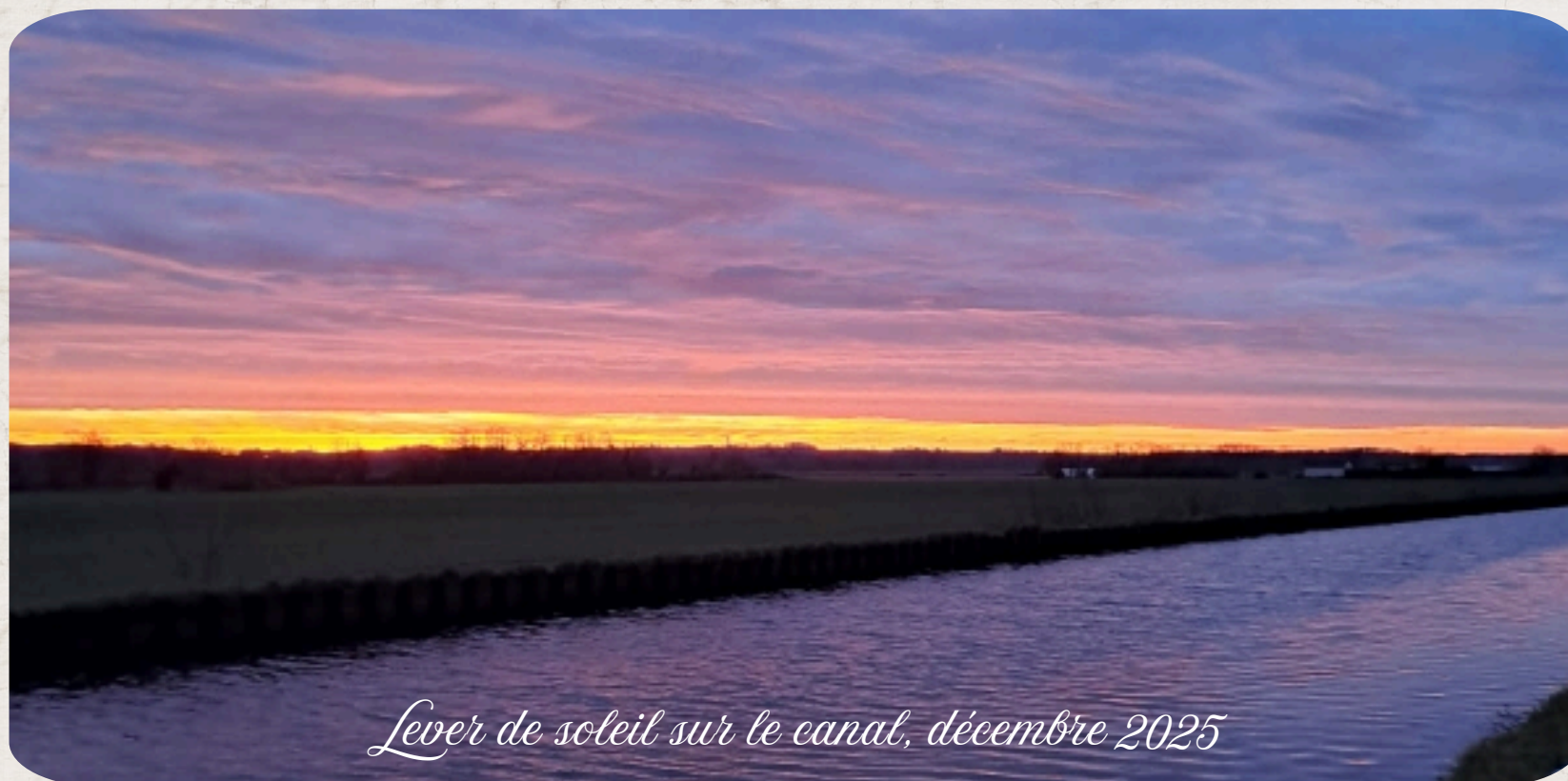
Lever de soleil sur le canal, décembre 2025